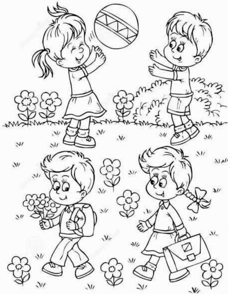
Hilsen os alle i Digterparkens Børnehus